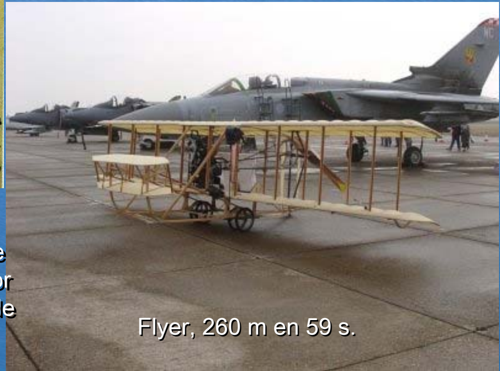
Flyer, 260 m en 59 s.

Wilbur y Orville Wright realizaron el primer vuelo pilotado de una aeronave más pesada que el aire propulsada por motor de explosión, 17 de diciembre de 1903, en Carolina del Norte, USA.